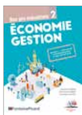
Réf. EGIN1-24 page 5