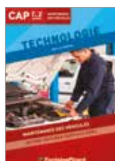
Réf. 694-24 page 11