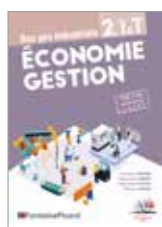
Réf. EGIN3-24 page 5