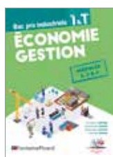
Réf. EGIN2-24 page 5