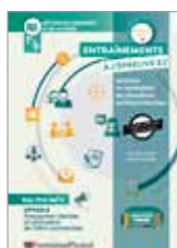
Réf. CV4-24 page 9