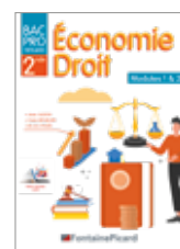
Réf. EDMA-24 page 6