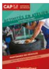
Réf. MVTP3-24 page 10